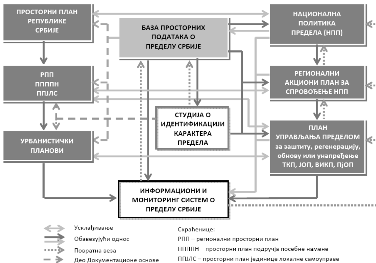
Слика 3. Интегрисање аспекта предела и координација планског основа у Србији