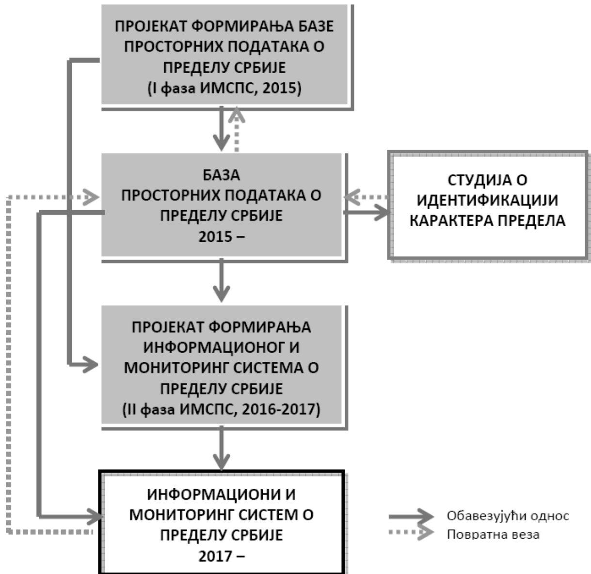
Слика 1: Формирање, функционисање и одржавање Базе просторних података о пределу Србије и Информационог и мониторинг система о пределу Србије