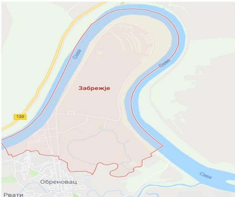
Slika 2.-Položaj predmetnog projekta u odnosu na šire područje (aerofoto snimak)

Posmatrani potez u koritu reke Save dužine 300 m, predstavlja potencijalno pozajmište rečnog nanosa. Bagerovanje sa njega mora biti kontrolisano, vodeći računa o režimu tečenja, kao i postojećim i planiranim hidrotehničkim i drugim objektima. Obzirom da se predviđeno eksploataciono polje nalazi u sektoru nepovoljno za plovidbu pri niskim vodostajima, eksploatacijom će se poboljšati uslovi plovidbe na ovom sektoru i uslovi prirodnog oticanja i pronosa vučenog nanosa.