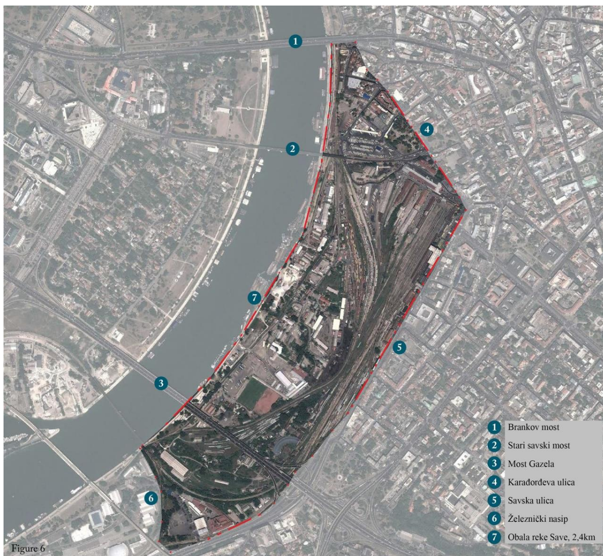
Slika 1. Uže okruženje lokacije – Područje „Beograd na vodi“