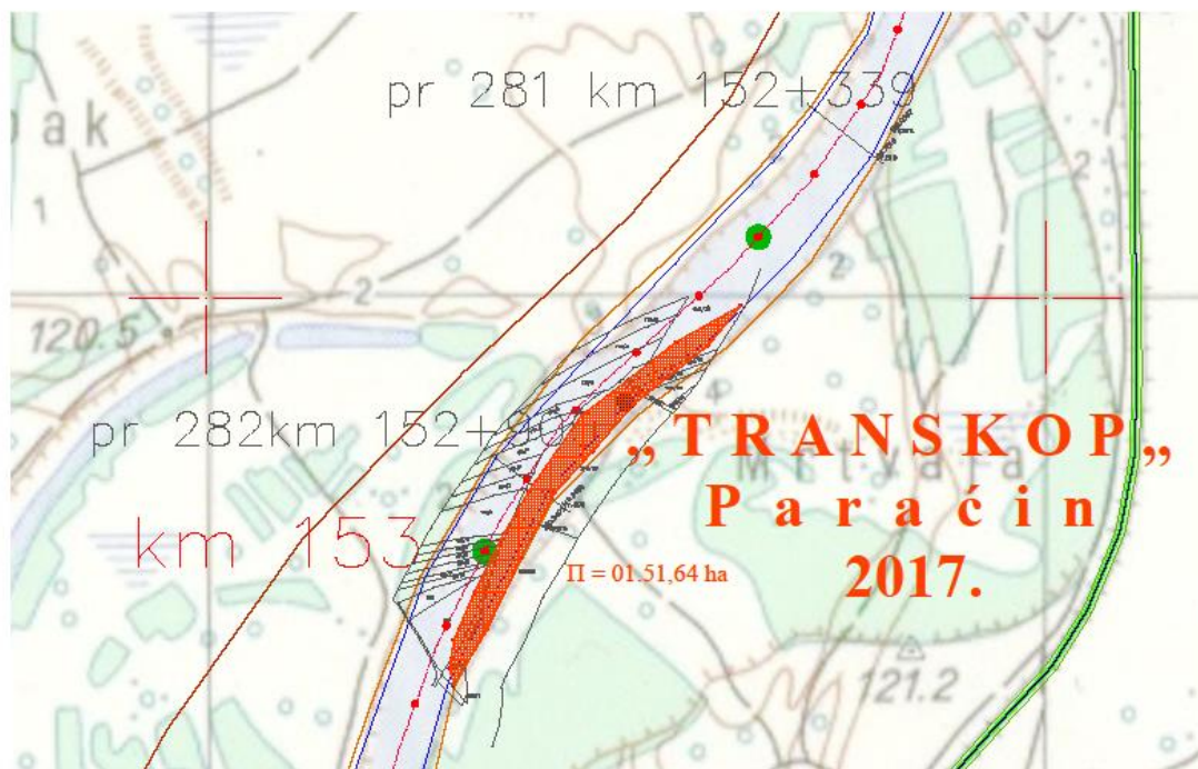
Сл.1. Шири локација експлоатационог поља

Приступни пут локацији за експлоатацију, која је предмет захтева, повезана је квалитетним насутим путем, у дужини од око 6 км., са погоном за прераду шљунка и производњу бетона, у власништву инвеститора.