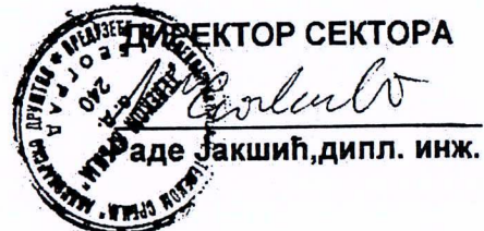
Прилог: Списак овлашћених запослених лица

Digitally signed by Rade Jakšić 100049085-2102968810051 DN: dc=rs, dc=posta, dc=ca, ou=Pravno lice (PL), ou=Preduzeće za telekomunikacije Telekom Srbija a.d. 17162543, cn=Rade Jakšić 100049085-2102968810051 Date: 2016.03.24 14:22:18 +01'00'