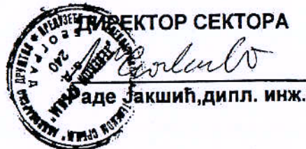
Прилог: Списак овлашћених запослених лица

Digitally signed by Rade Jakšić 100049085-2102968810051 DN: dc=rs, dc=posta, dc=ca, ou=Pravno lice (PL), ou=Preduzeće za telekomunikacije Telekom Srbija a.d. 17162543, cn=Rade Jakšić 100049085-2102968810051 Date: 2016.03.24 14:22:18 +01'00'