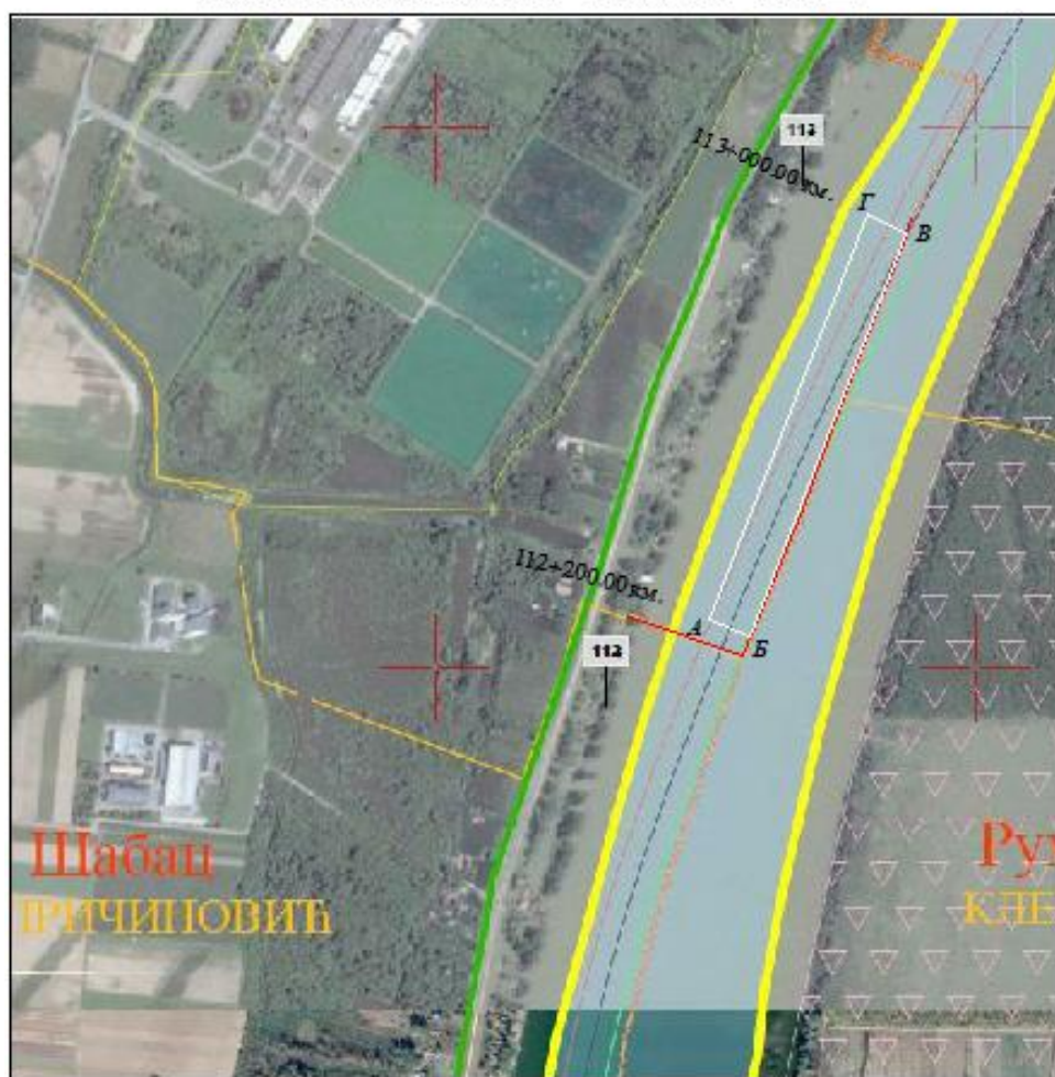
Координате границе експлоатационог поља