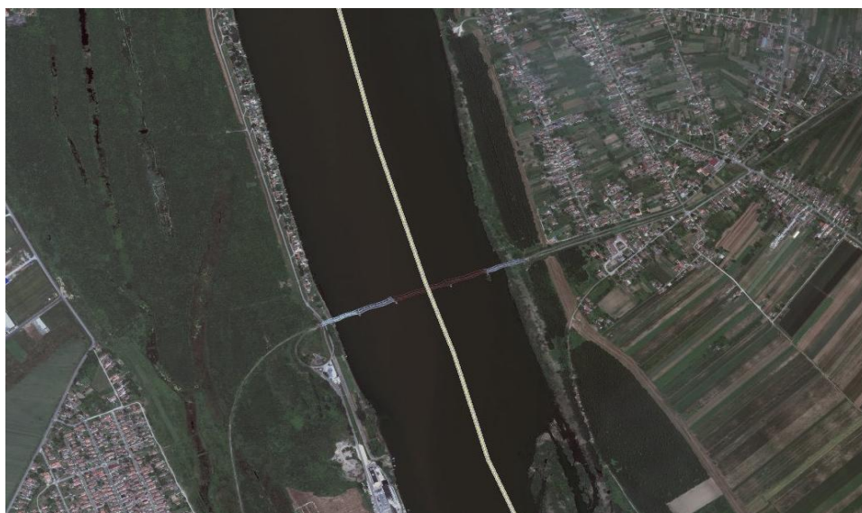
-Položaj predmetnog projekta u odnosu na šire područje

Posmatrani potez u koritu reke Save dužine 200 m. odnosno površine od 1.98 ha, predstavlja potencijalno pozajmište rečnog nanosa. Bagerovanje sa njega mora biti kontrolisano, vodeći računa o režimu tečenja, kao i postojećim i planiranim hidrotehničkim i drugim objektima. Obzirom da se predviđeno eksploataciono polje nalazi u sektoru nepovoljno za plovidbu pri niskim vodostajima, eksploatacijom će se poboljšati uslovi plovidbe na ovom sektoru i uslovi prirodnog oticanja i pronosa vučenog nanosa.