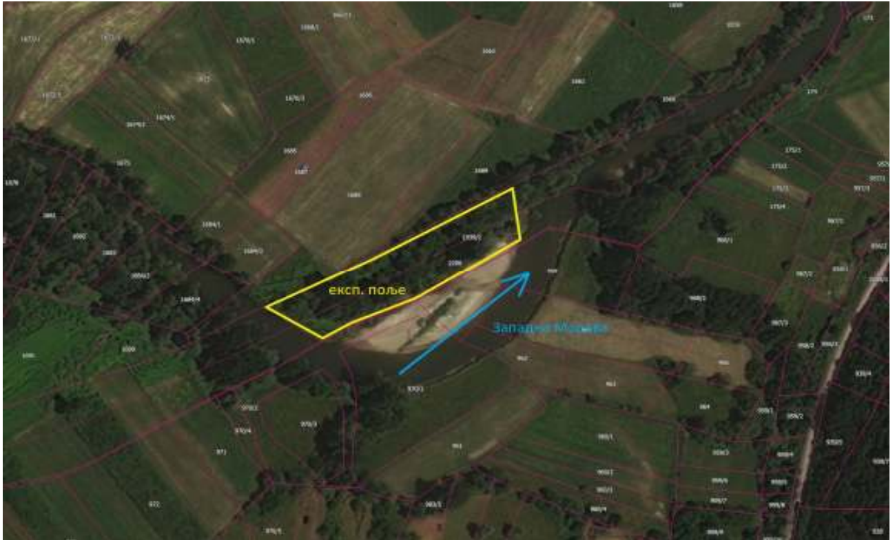
Орто-фото снимак експлоатационог поља измрђу км 181+850 - км 182+053 у Пилатовићима код Пожеге

Ископ се може вршити највише до коте талвега на предметној деоници.