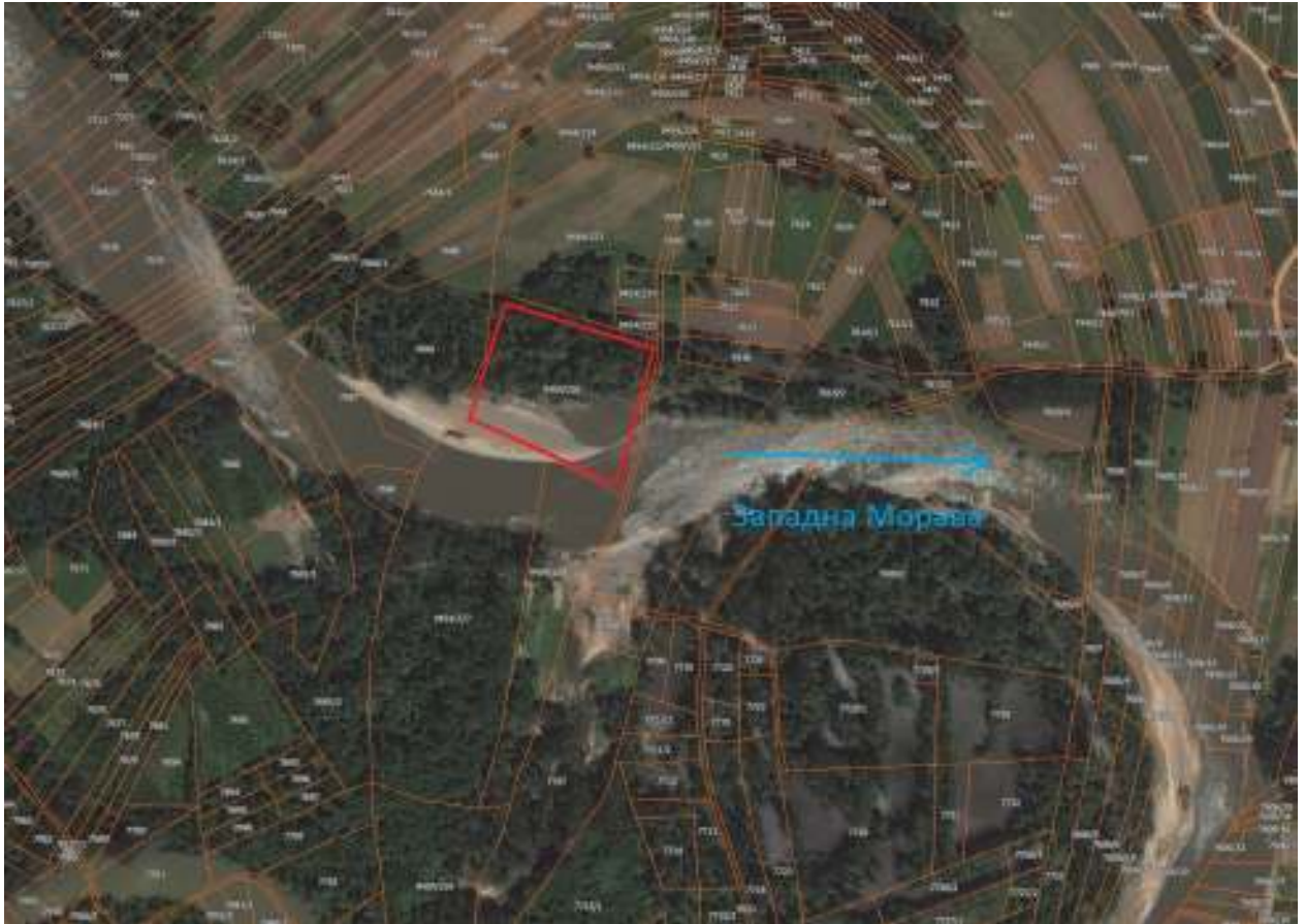
Орто-фото приказ експлоатационог поља ( https://a3.geosrbija.rs/ ) Између км46+500 - км 46+700 у Медвеђи – општина Трстеник