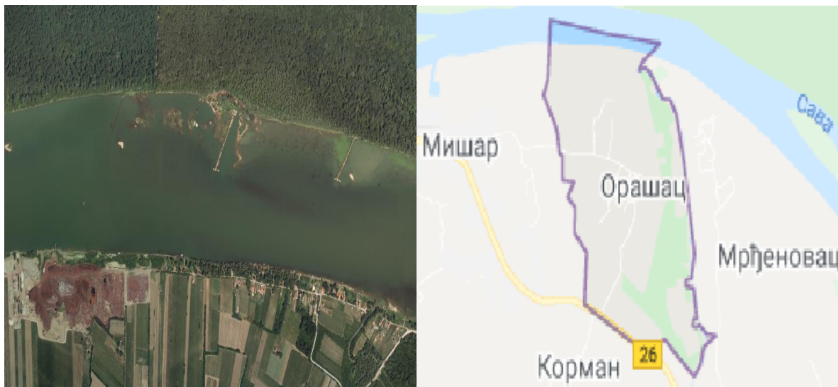
-Položaj predmetnog projekta u odnosu na šire područje

Posmatrani potez u koritu reke Save dužine 400 m. odnosno površine od 3,95 ha, predstavlja potencijalno pozajmište rečnog nanosa. Bagerovanje sa njega mora biti kontrolisano, vodeći računa o režimu tečenja, kao i postojećim i planiranim hidrotehničkim i drugim objektima. Obzirom da se predviđeno eksploataciono polje nalazi u sektoru nepovoljno za plovidbu pri niskim vodostajima, eksploatacijom će se poboljšati uslovi plovidbe na ovom sektoru i uslovi prirodnog oticanja i pronosa vučenog nanosa.