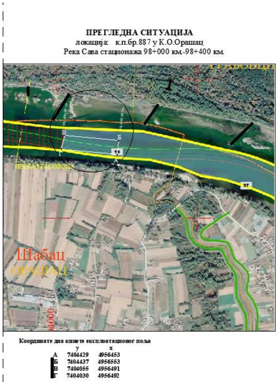
Slika -Situacija šire lokacije reke Save (od km 98+000 do km 98+400)

Pozajmište pripada K.O. Orašac. Samo eksploataciono polje je deo vodnog zemljišta u površini 3,95 ha , od ukupne površine katastarske parcele broj 887 K.O. Orašac.