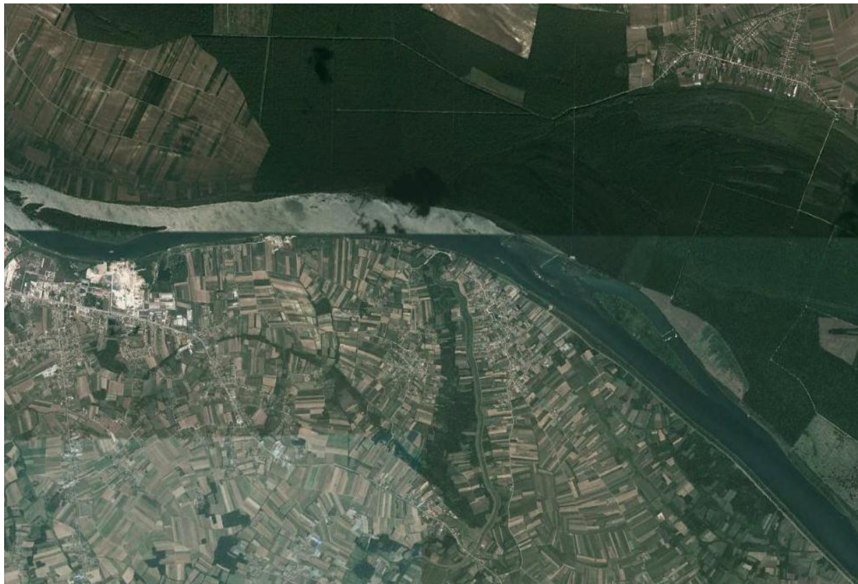
Slika 4.-Položaj predmetnog projekta u odnosu na šire područje (aerofoto snimak)

Posmatrani potez u koritu reke Save dužine 250 m, predstavlja potencijalno pozajmište rečnog nanosa. Bagerovanje sa njega mora biti kontrolisano, vodeći računa o režimu tečenja, kao i postojećim i planiranim hidrotehničkim i drugim objektima. Obzirom da se predviđeno eksploataciono polje nalazi u sektoru nepovoljno za plovidbu pri niskim vodostajima, eksploatacijom će se poboljšati uslovi plovidbe na ovom sektoru i uslovi prirodnog oticanja i pronosa vučenog nanosa.