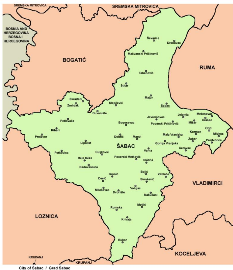
Slika 2. - Makrolokacija (Opština Šabac)