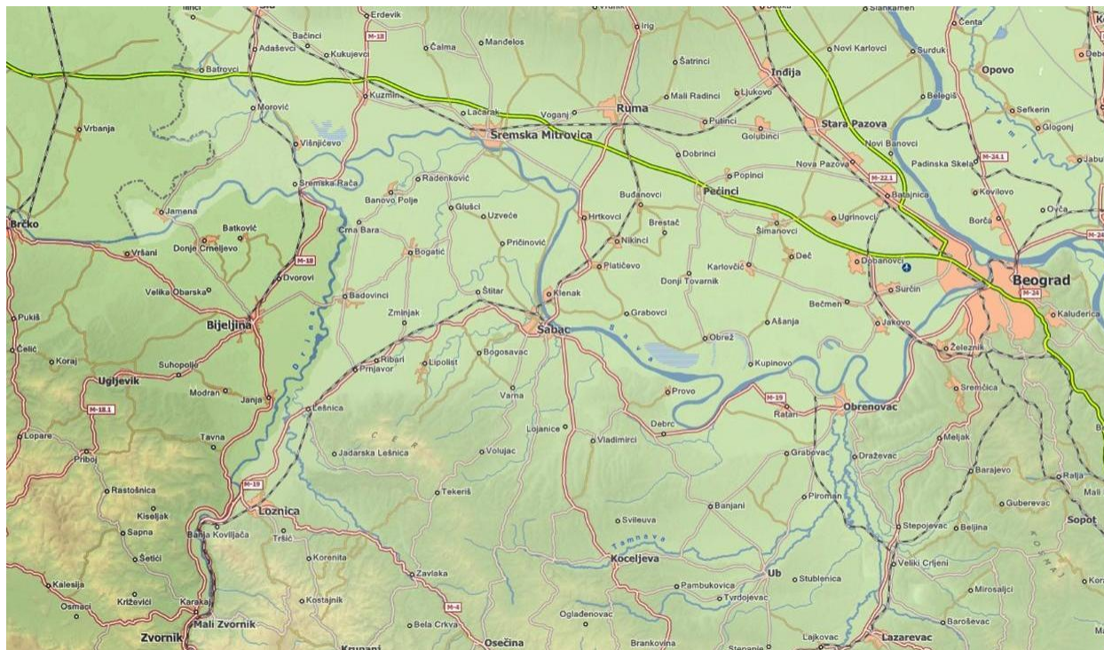
Slika 3. – Putna mreža sa širim okruženjem

Opština i grad Šabac zahvataju severni deo severozapadne Srbije. Geografski položaj opštine je veoma povoljan jer se nalazi na važnim saobraćajnim pravcima: drumskim, železničkim i rečnim, i u blizini je velikih gradova Beograda i Novog Sada. Opština Šabac prostire se na površini od 795 km 2 i ima 122.320 stanovnika. U gradu, sa prigradskim naseljima, živi oko 70.000 stanovnika. Osnovni privredni potencijali su kvalitetno zemljište pogodno za sve vrste poljoprivredne proizvodnje, a vode reka Save i Drine pogoduju razvoju brojnih privrednih grana; industrije, vodoprivrede, poljoprivrede, rečnog saobraćaja i turizma. Grad Šabac je oduvek bio ekonomski i kulturni centar Podrinja i šireg područja.