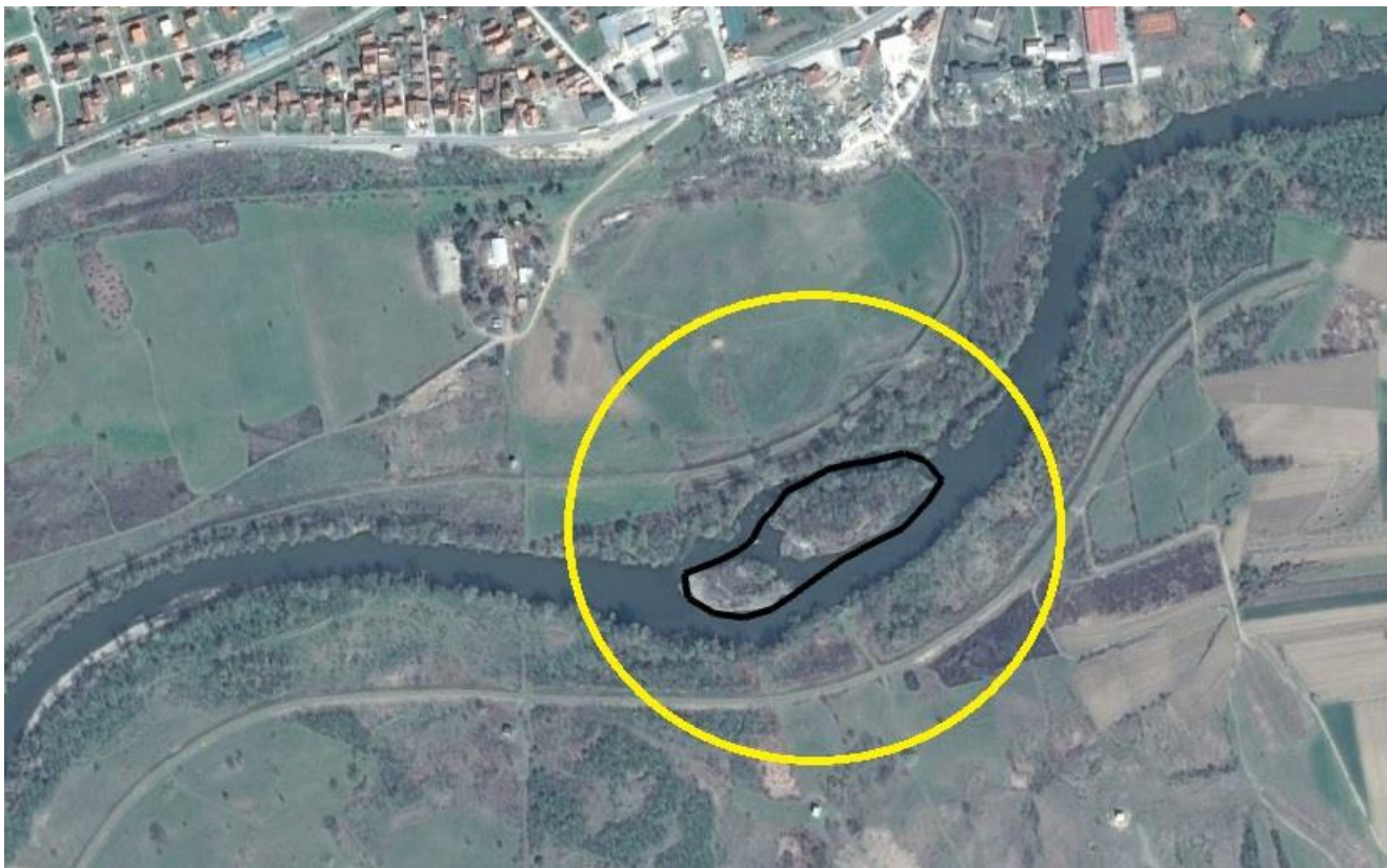
Орто-фото снимак експлоатационог поља са спрудом у кориту реке Ибар на стационажи од км 10+600 - км 10+950 у Чибуковцу код Краљева

Експлоатационо поље које је предмет овог Пројекта, налази се на спруду у кориту реке Ибар на стационажи од км 10+600 до км 10+950, на кп.бр. 621 КО Чибуковац – град Краљево.