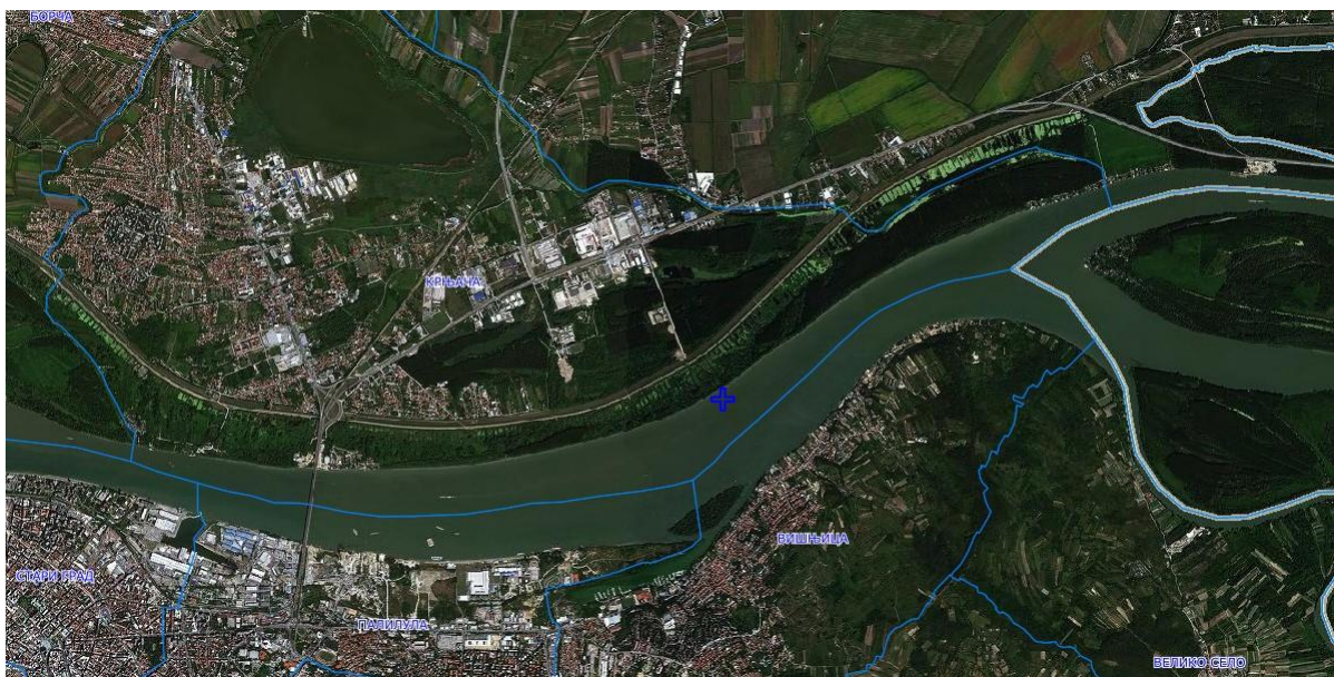
-Položaj predmetnog projekta u odnosu na šire područje

Posmatrani potez u koritu reke Dunav dužine 0,2 km. odnosno površine od 94.086,00m 2 , predstavlja potencijalno pozajmište rečnog nanosa. Bagerovanje sa njega mora biti kontrolisano, vodeći računa o režimu tečenja, kao i postojećim i planiranim hidrotehničkim i drugim objektima. Obzirom da se predviđeno eksploataciono polje nalazi u sektoru nepovoljno za plovidbu pri niskim vodostajima, eksploatacijom će se poboljšati uslovi plovidbe na ovom sektoru i uslovi prirodnog oticanja i pronosa vučenog nanosa.