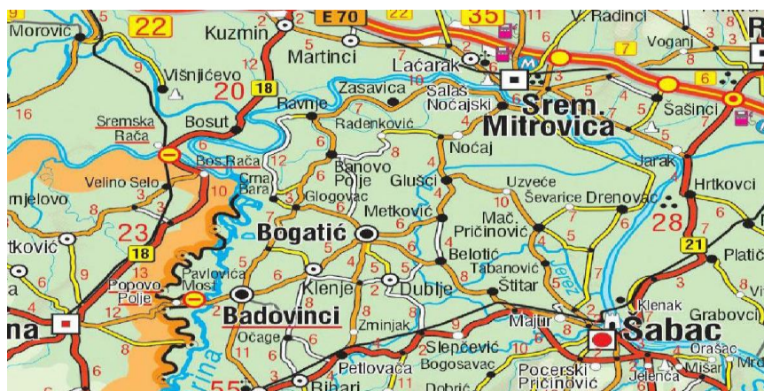
Slika 2. – Putna mreža sa širim okruženjem

Selo je ušorenog tipa sa 19 ulica i 4 pravilna raskršća. Sve ulice u selu su asfaltirane a uličnom rasvetom je pokriveno oko 30% naselja. Poljski putevi su u veoma dobrom stanju.