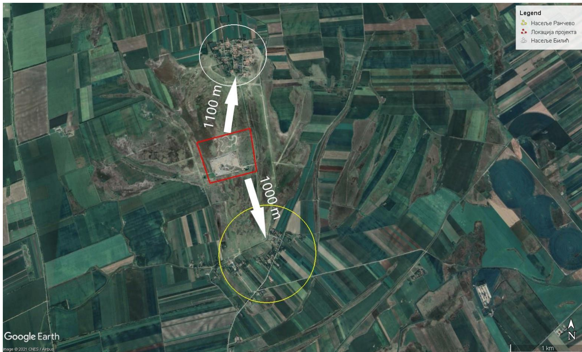
Слика 2 Локација пројекта РЦУО Сомбор