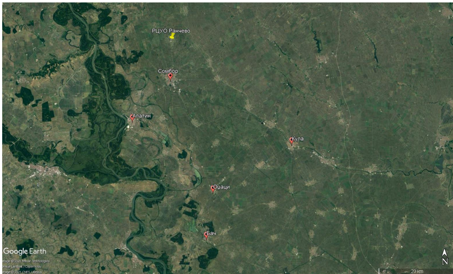
Слика 1 Макро локација Пројекта