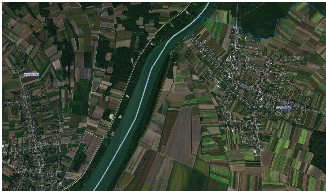
-Položaj predmetnog projekta u odnosu na šire područje

Posmatrani potez u koritu reke Save dužine 2 km. odnosno površine od 18,4656 ha, predstavlja potencijalno pozajmište rečnog nanosa. Bagerovanje sa njega mora biti kontrolisano, vodeći računa o režimu tečenja, kao i postojećim i planiranim hidrotehničkim i drugim objektima. Obzirom da se predviđeno eksploataciono polje nalazi u sektoru nepovoljno za plovidbu pri niskim vodostajima, eksploatacijom će se poboljšati uslovi plovidbe na ovom sektoru i uslovi prirodnog oticanja i pronosa vučenog nanosa.