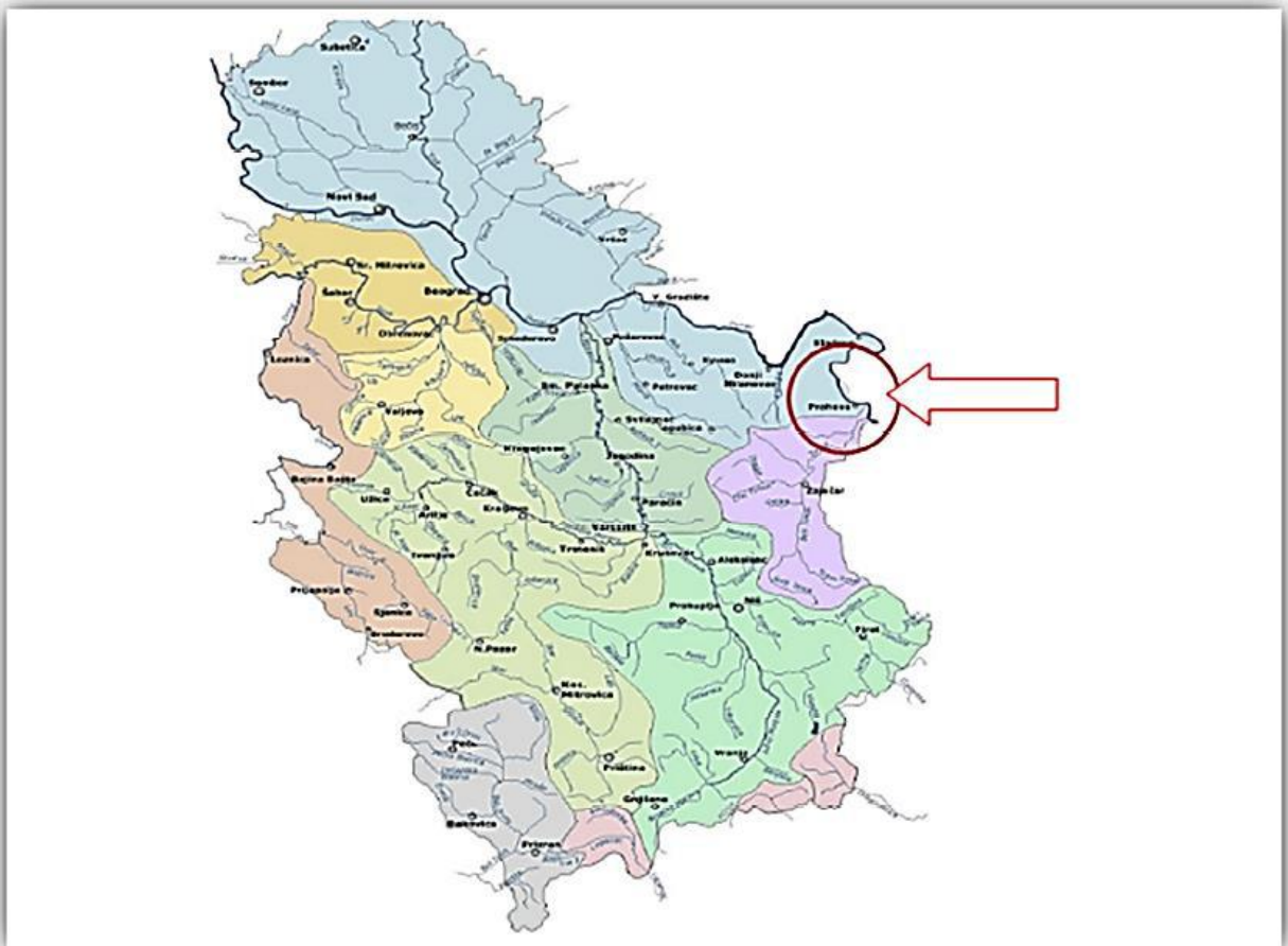
Slika 1. Prikaz naselja Prahovo u opštini Negotin na mapi Srbije (makrolokacija)

Industrijski kompleks „Elixir Prahovo - Industrija hemijskih proizvoda d.o.o. Prahovo“ smešten je pored obale Dunava, kod luke Prahovo, u okviru K.O. Prahovo, koja pripada opštini Negotin. U njegovom okruženju nalaze se i sledeći industrijski i privredni kompleksi: