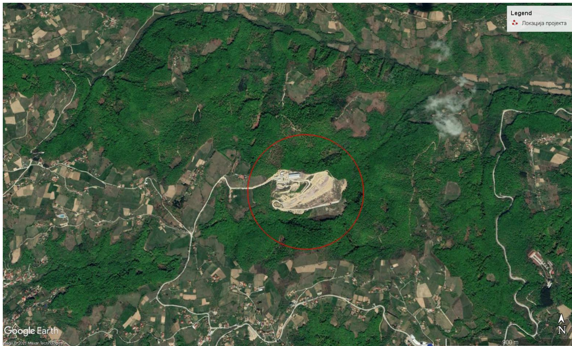
Слика 2 Локација санитарне депоније Дубоко