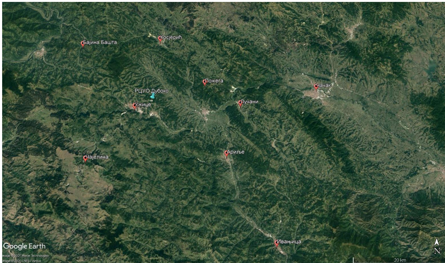
Слика 1 Локација РЦУО Дубоко